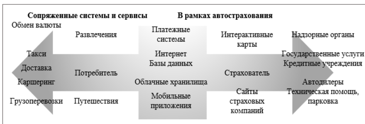
Рисунок 2. Модель экосистемы цифрового автострахования

Задачами экосистемы автострахования определены: объединение цифровых технических возможностей и сервисов для поиска и удержания клиентов; расширение каналов продаж; создание удобных условий приобретения и использования страховых продуктов; интеграция страховых продуктов в различные отрасли. (Рисунок 2).