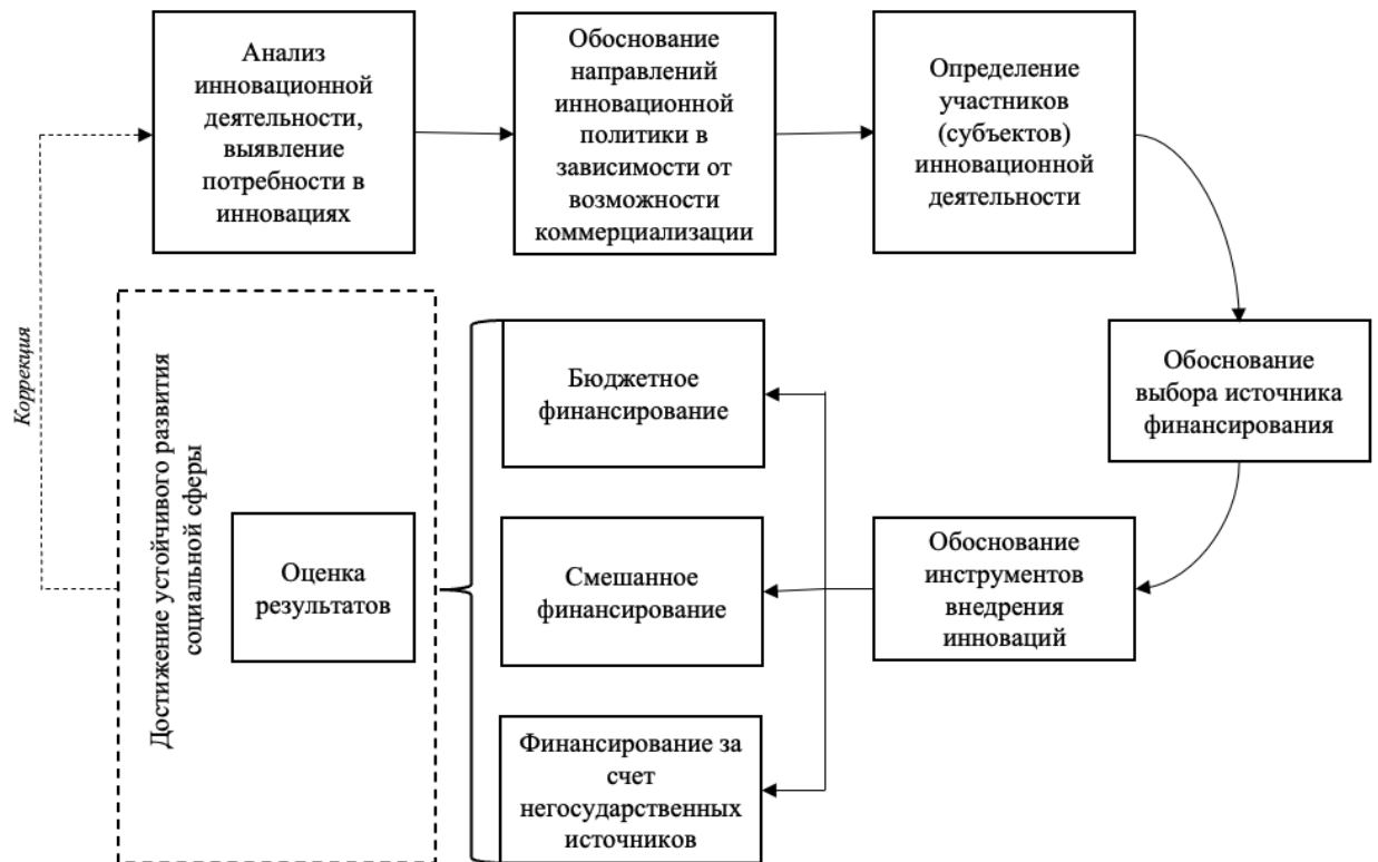
Рисунок 2 – Механизм региональной инновационной политики в социальной сфере

- социально-психологические (инструменты - социальная реклама, проведение конкурсов, инструменты мотивации хозяйствующих субъектов и НКО, премии и т.д.).