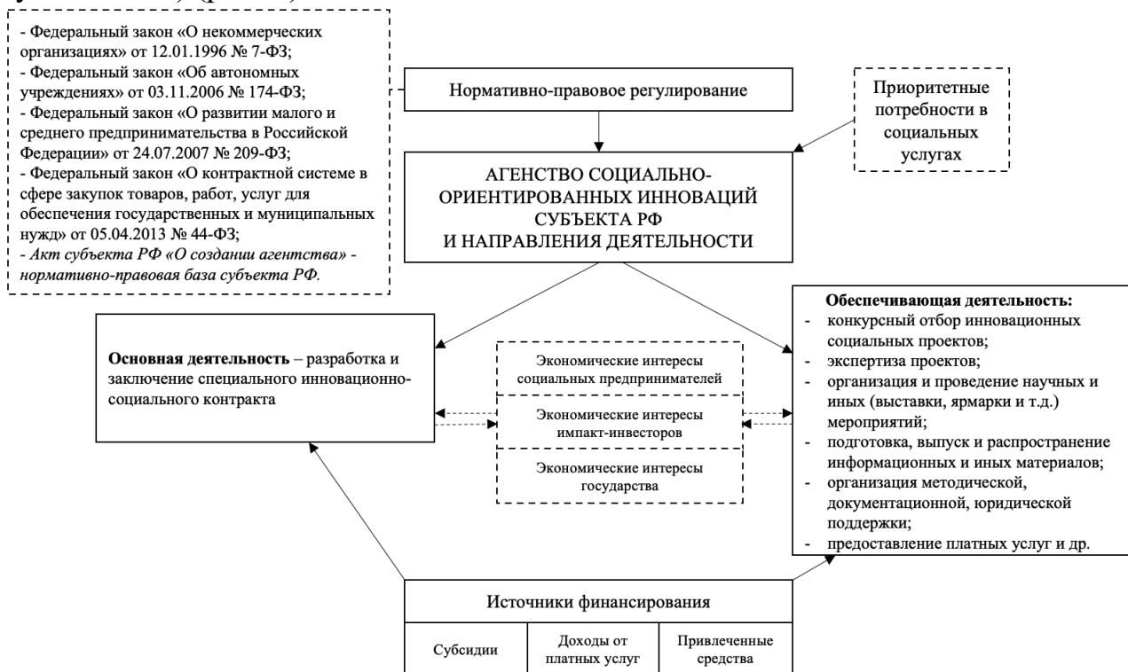
Рисунок 5 - Агентство социально-ориентированных инноваций субъекта РФ

Агентство социально-ориентированных инноваций субъекта является некоммерческой организацией, созданной в форме государственного автономного учреждения. Учредителем и собственником имущества Агентства является субъект Российской Федерации. Функции и полномочия учредителя Агентства от имени региона осуществляет Правительство (Администрация субъекта РФ) (рис. 5).