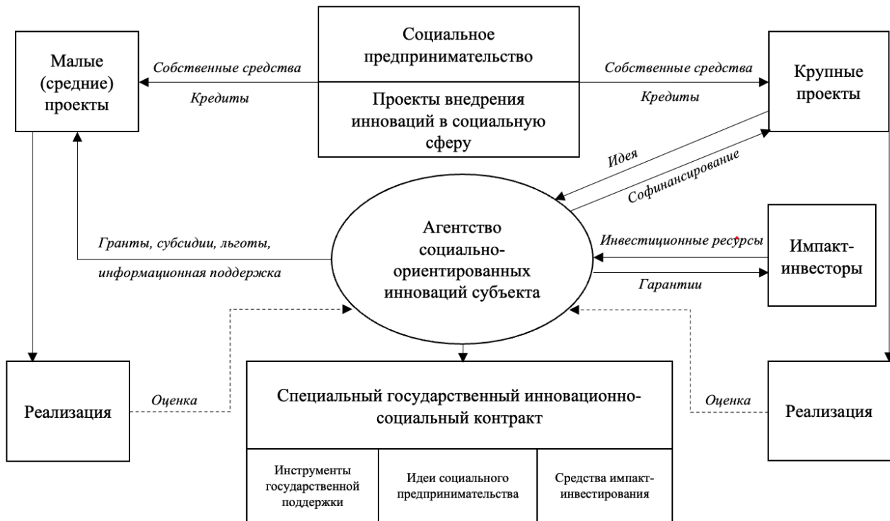
Рисунок 6 – Алгоритм формирования специального государственного социального контракта